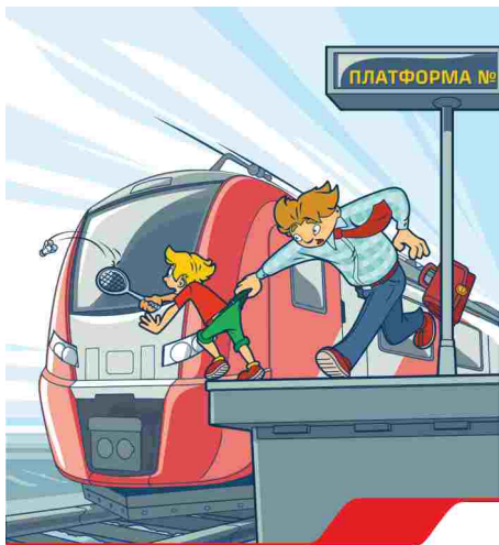
Железная дорога – не место для игр!