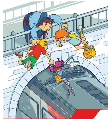
Проезд на крышах и подножках вагона опасен и может стоить жизни!